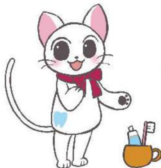
マスコットキャラクター アリガトーネちゃん